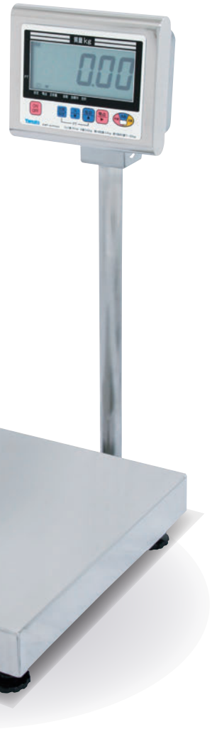
防水型デジタル台はかり